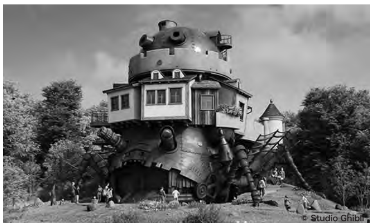
魔女の谷 映画「魔女の宅急便」、「ハウルの動く城」などに描かれているヨーロッパ風の空間をイメージし、「オキノ邸」と庭園、「ハウルの城」と荒地、「レストラン棟」等を整備します。

スタートアップ・パートナー企業向けオフィス、テックラボ、イベントスペース、あいち創業館、宿泊施設、託児施設、カフェ・レストラン等