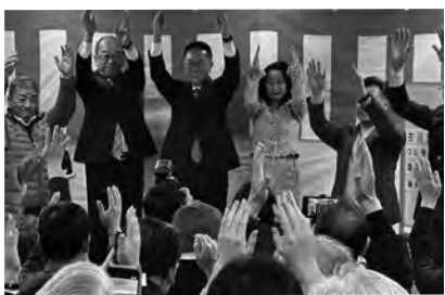
第51回 衆議院議員総選挙 愛知2区(名東、千種、守山) 投票率57.21%

本年2月8日投開票の衆議院議員選挙で、古川元久候補はお陰様で小選挙区で勝利し、11回目の当選ができました。11万票を超える得票をいただきまいたこと心から感謝申し上げます。多くのご声援に励まされ頑張ることができました。今後とも、国、県、市と連携しながら頑張っております。