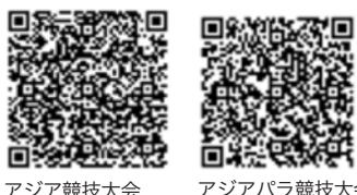
アジア競技大会 アジアパラ競技大会